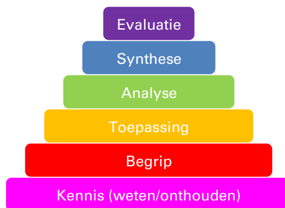
Taxonomie van Bloom

Aan de basis van de formulering van de toetstermen in dit kwalificatiedossier ligt de taxonomie van Bloom. Dit is een indeling in zes beheersingsniveaus, die verwijzen naar de verschillende denkprocessen. De benodigde denkprocessen onderin de piramide zijn eenvoudiger van aard dan de processen bovenin de piramide.