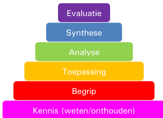
Taxonomie van Bloom

denkprocessen. De benodigde denkprocessen onderin de piramide zijn eenvoudiger van aard dan de processen bovenin de piramide.