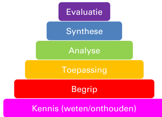
Taxonomie van Bloom

benodigde denkprocessen onderin de piramide zijn eenvoudiger van aard dan de processen bovenin de piramide.